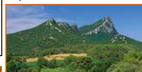
Le Pic Saint-Loup

Le club héraultais est partenaire du Festa Trail Pic Saint-Loup dont l'objectif est la découverte des patrimoines naturels et culturels du Languedoc, région riche de paysages exceptionnels. Cette manifestation se déroulera les 20,21,22 mai. Les Rotariens sont invités à participer au challenge pour les équipes Rotariennes sur le Marathon de l'Hortus par équipes (23 mai).