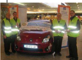
La voiture, lot unique de la tombola

Une tombola a été organisée début février par le Club de Balma à l'occasion de son 20ème anniversaire, en partenariat avec la centaine de commerces d'un centre commercial, au profit de la Ligue 31 de lutte contre le cancer sur le thème « Accompagner pour aider ». Soutien psychologique, aide sociale, art thérapie, consultations diététiques et activités physiques spécialisées sont dispensés dans la toute nouvelle commune du campus de cancérologie sur le site de Langlade que les rotariens souhaitent aider. Cette opération devait être conduite dans divers lieux.