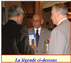
La légende ci-dessous