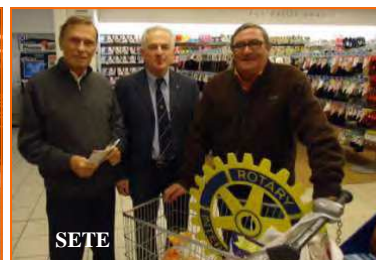
Quelques uns des nombreux sites de collectes du D 1700