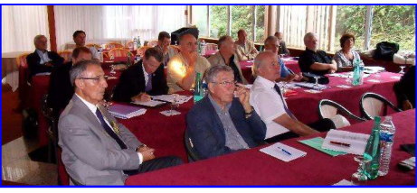
Reportage Maurice Charbonnières